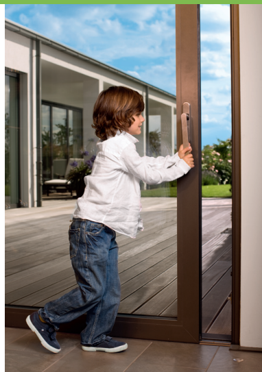
Fließende Übergänge zwischen Wohnraum und Terrasse.